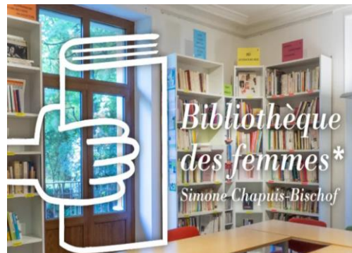
Février 2023 à la Maison de la Femme : la nouvelle bibliothèque féministe.