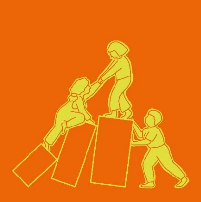
Logo: riposter et se reconstruire après la violence

Aujourd'hui encore, les femmes sont au moins deux fois plus nombreuses que les hommes à subir des violences domestiques, allant du harcèlement au quotidien jusqu'au meurtre, le féminicide. D'après l' office fédéral de la statistique « en 2023, les femmes représentaient 70,1% des personnes lésées d'actes de violence domestique (11 479) enregistrées par la police. Cette répartition inégale entre femmes et hommes est particulièrement visible dans le couple, séparé ou non... » Or, le nombre de cas non déclarés est très élevé.