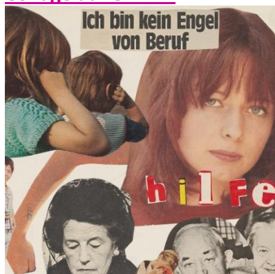
Collage de l'année 1975