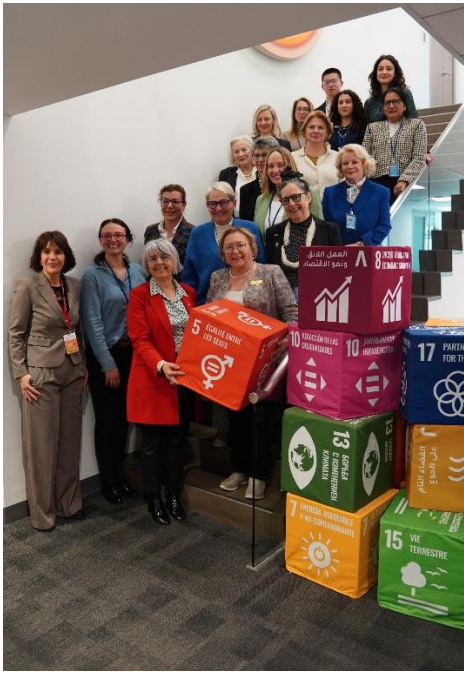
Photo : Réunion de la délégation des ONG suisses avec la conseillère fédérale Elisabeth Baume-Schneider à la Mission suisse à New York

Il y a un an déjà, j'ai pris contact avec la Mission suisse auprès des Nations Unies à New York afin d'améliorer la coopération pendant la CSW. Lors de deux réunions, des déléguées de sept ONG suisses présentes à la CSW ont été invitées à la Mission suisse. La conseillère fédérale Mme Baume-Schneider a pris note de nos souhaits pour la coopération future. A l'avenir, les ONG se mettront en réseau et se présenteront de manière unie, comme je l'ai suggéré. »