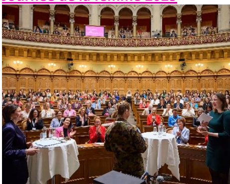
Journée de la femme 7 mars 2025