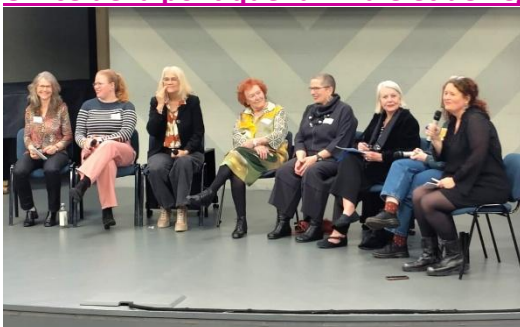
Participantes à la table ronde